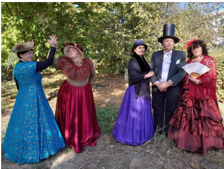
Пушкинский день России