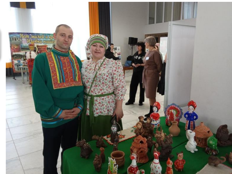
70-летие образования Белгородской области