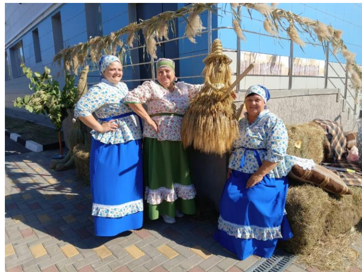
Всероссийский фестиваль народной кухни, музыки и ремёсел «На Тихой Сосне»

В рамках реализации программы было проведено десять социокультурных мероприятий, каждое из которых имело свою тематическую направленность и особенности. В этих мероприятиях приняли активное участие более 75 человек.